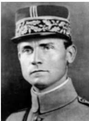
Milan Rastislav Štefánik